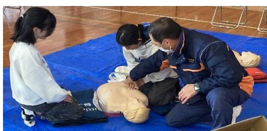
人形による甦生術の体験