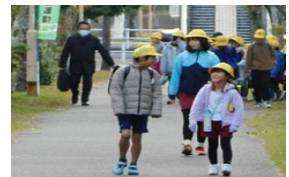
小学生の遊歩道での登校状況(2)