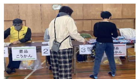
スタンプラリーゴール後の抽選