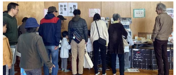
防災グッズの展示(皆さん 興味津々)