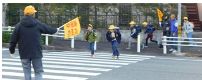
交差点での立哨活動

12月1日(日)から10日(火)のうち平日の7日間に、旭行政区内の4か所の危険交差点で、主に小中学生の安全な横断のための立哨活動を行いました。分団登校の小学生たちは交差点の横断後に遊歩道を通って登下校しますが、自転車等の一般通行の支障とならないように指定された側を歩く習慣がようやく定着し始めたようです。