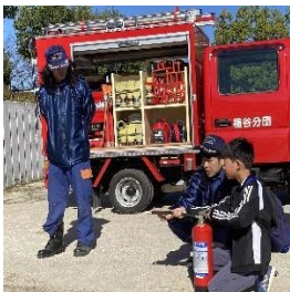
消火器の操作体験