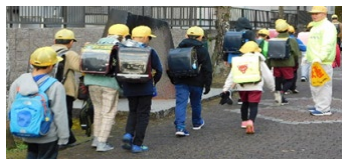
小学生の遊歩道での登校状況(1)