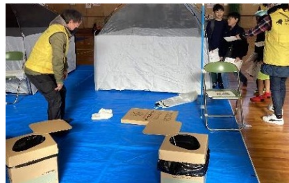
簡易トイレとテントの展示