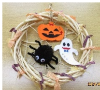
ハロウィンリース