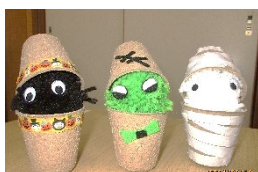
かくれんぼオバケ