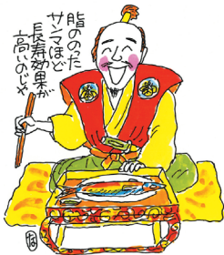
秀吉のサンマ健康法

「福と禄(ろく)とは及びもないが寿(ながいき)ならばともかく」は、江戸時代の禅僧として有名な白隠禅師のことばである。