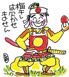
息合(いきあい)の最上は梅なり