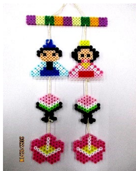
アイロンビーズ おひなさま