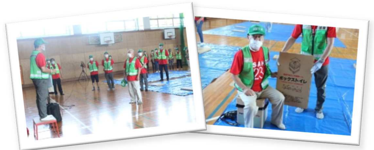
(当日の様子は4ページをご覧ください)

9月5日(日)に、三好丘行政区と合同で三好丘地区コミュニティの約60名が参加し、防災訓練を実施しました。