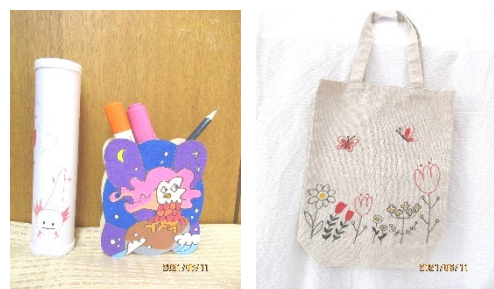
万華鏡・小物入れ・エコバッグ